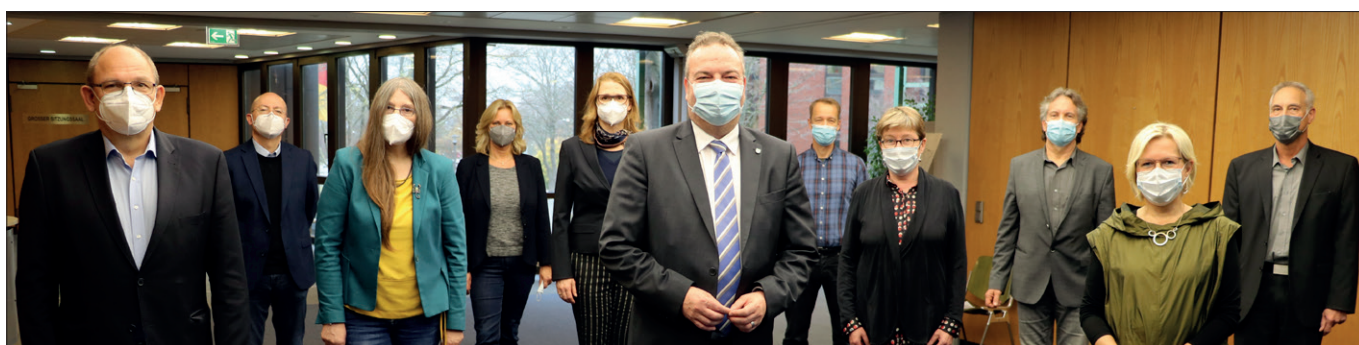
Vestischer Berufskolleg-Verbund mit Landrat Bodo Klimpel -vorne Mitte-

Landrat Bodo Klimpel war bei den Schulleitungen im Vestischen Berufskolleg-Verbund (VBV) zu Gast und hat sich über den Stand der Planungen des gemeinsamen Schulversuchs „Regionale Bildungszentren“ informiert. Bei den finalen Planungsüberlegungen wurde im Gespräch sehr deutlich, dass „Beste Bildung“ ein weiterer stetiger Anspruch bleiben wird, den der Kreis Recklinghausen nun seit mehr als 10 Jahren verfolgt. Der beabsichtigte Schulversuch aller Berufskollegs in Trägerschaft des Kreises Recklinghausen wird dabei u. a. die Bildungsgerechtigkeit stärken, die im Besonderen die duale- und vollschulische Ausbildung voranbringen wird.